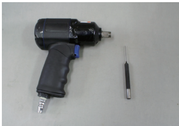
①直径 1.5 ミリのポンチを用意します。

トリガー内部の O リングに汚れたオイルが固着して動かなくなっております。 修理に出す前に、下記の手順に従いメンテナンスしていただきますと可動するようになります。