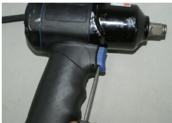
③トリガー下部の穴にピックツールを差し込みトリガーを抜きます。