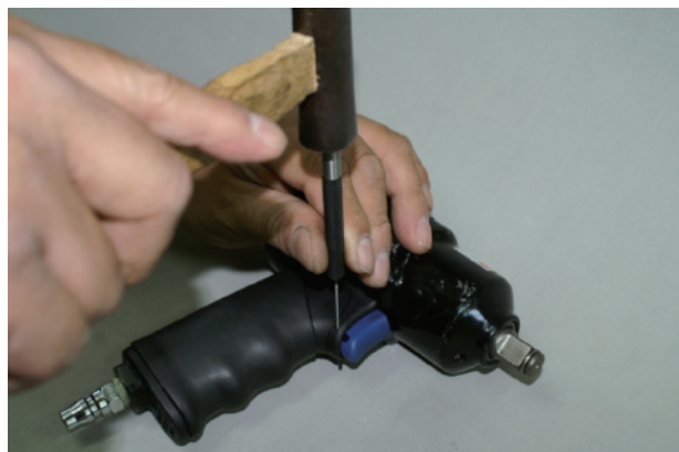
②トリガーの手前にある穴にポンチを入れてハンマーで叩きピンを抜きます。