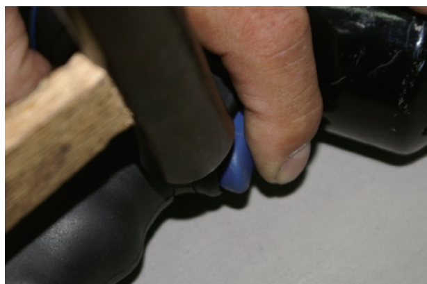
⑥トリガーを少し押しながらピンを差し込みます。さらにハンマーで叩き、ポンチで調整します。 ※上記の手順の行っても、戻りが悪い場合は、トリガーを新品に交換して下さい。