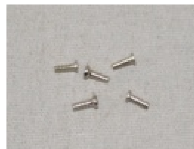
型式: SL-RN 1個 50円