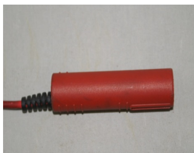
型式: SL-D 1,000円