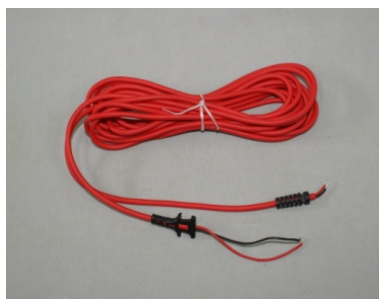
型式: SL-SC 3,500円