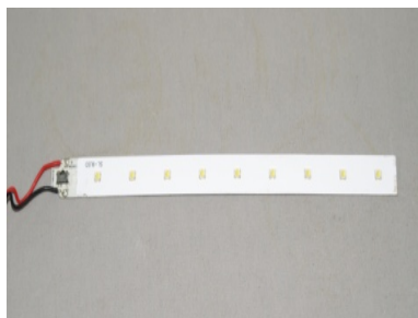
型式: SL-H 4,000円