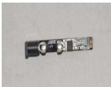
型式: SK-K 2,500円