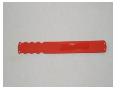
型式: SL-R 1,000円