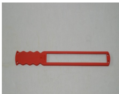
型式: SL-F 1,500円