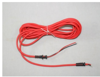
型式: SL-HC 2,000円